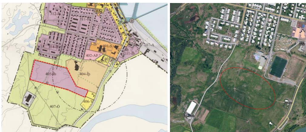
Mynd 2 Til vinstri, mynd úr aðalskipulagi Dalvíkurbyggðar 2008-2020 með síðari breytingum. Til hægri, loftmynd af svæðinu af kortavef Dalvíkurbyggðar, svæðið sýnt skematískt með rauðum hring.

Afmörkun skipulagssvæðisins miðast við reit 405-Íb í Aðalskipulagi Dalvíkurbyggðar 2008-2020. Reiturinn liggur innan reitar 407-Ó og að reit 404-Íþ sem er austan og norðan við reitinn og að reit 406-V sem er austan við reitinn, sjá mynd 2.